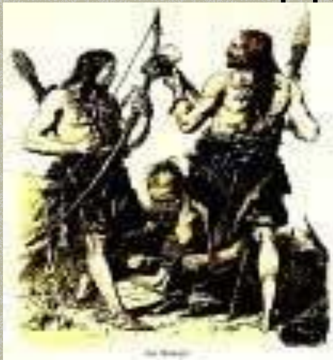
Ilustração: “Homem primitivo.”