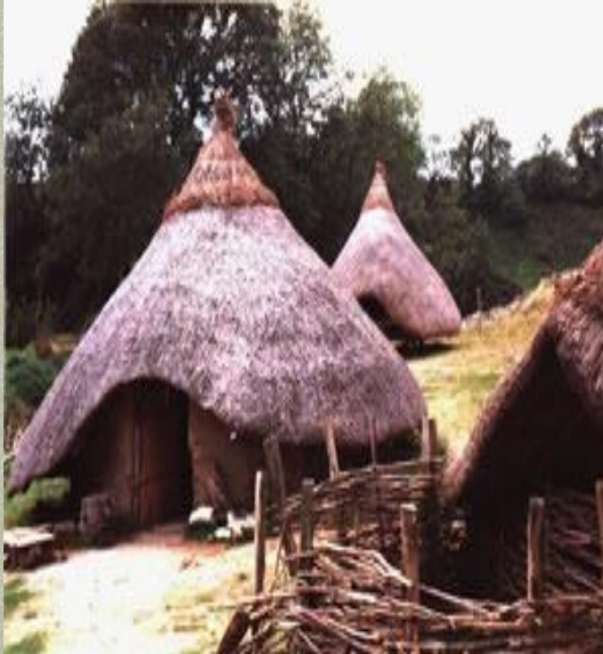
Ilustração: “Réplica de habitações típicas do final do Neolítico.”